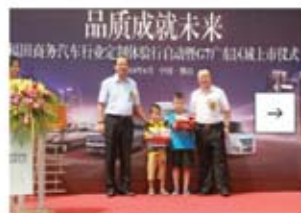
福田汽车集团开展“七彩书屋”公益捐赠活动