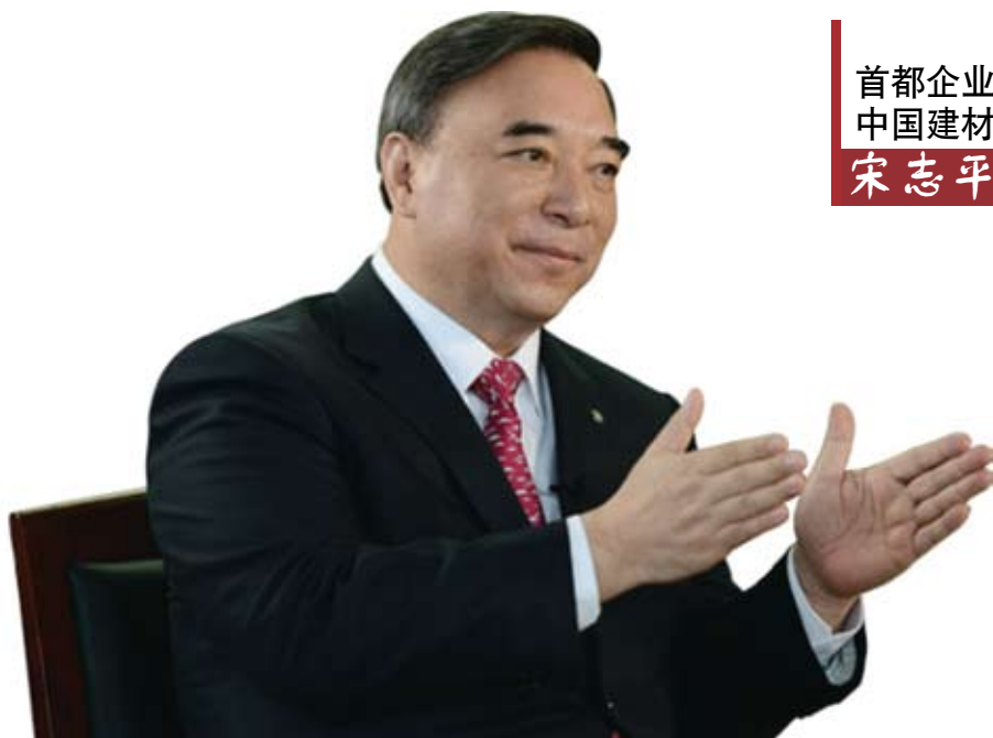
首都企业家俱乐部理事长 中国建材集团有限公司董事长 宋志平