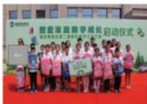
福田商用车“智慧家庭助学成长”第二届爱心助学公益之旅启动