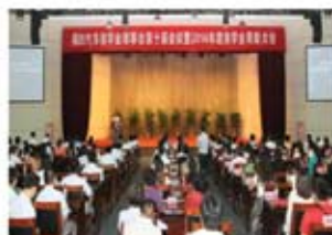
福田奖学金捐赠奖励优秀教师