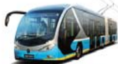
福田欧辉智蓝F9-BJ6180系列