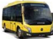
福田欧辉智蓝F3-BJ6650系列