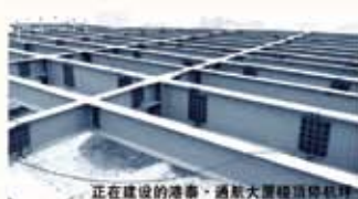
正在建设的港泰·通航大厦楼顶停机坪