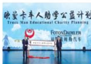
关爱卡车司机 关爱EST超级卡车携公益前行