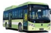
福田欧辉智蓝F9-BJ851系列