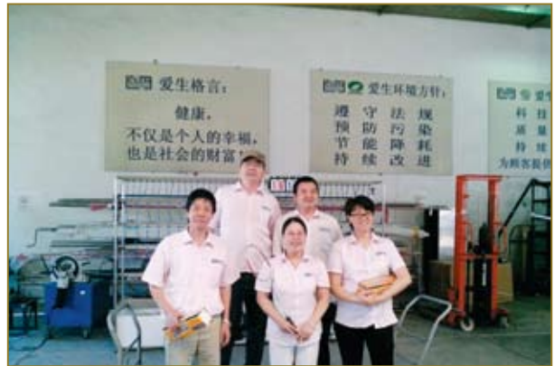
爱生羽毛球比赛获奖者合影。