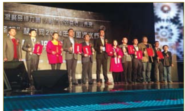
爱生科技荣获十大公共饮水设备优质供应商奖。