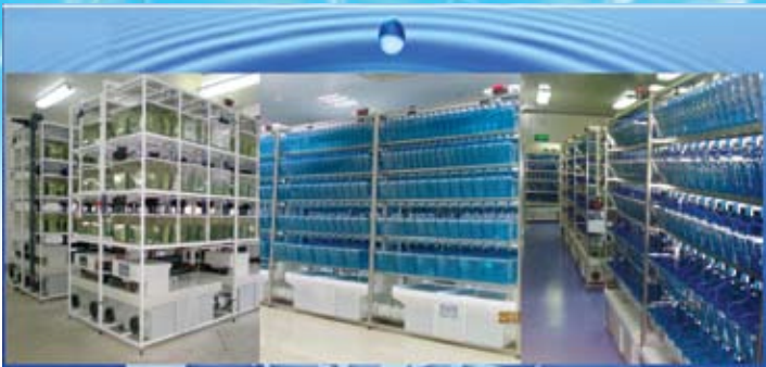
爱生研究级水生模式动物繁育系统设备实景图