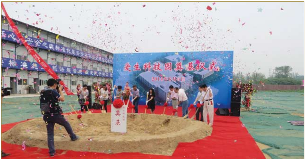
爱生科技园奠基仪式。