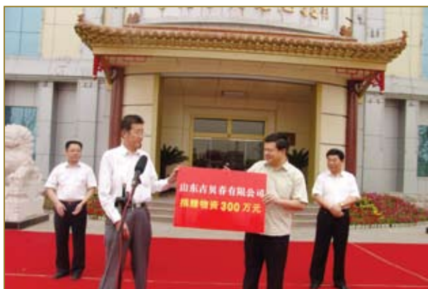
向汶川地震捐赠300万元物资。