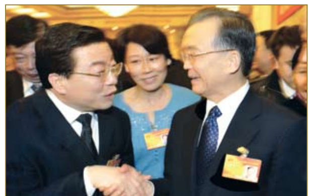
2010年3月8日，时任国务院总理温家宝在十一届三次会议山东代表团驻地听取了周晓峰关于企业情况简要介绍后，与其亲切握手并交谈。