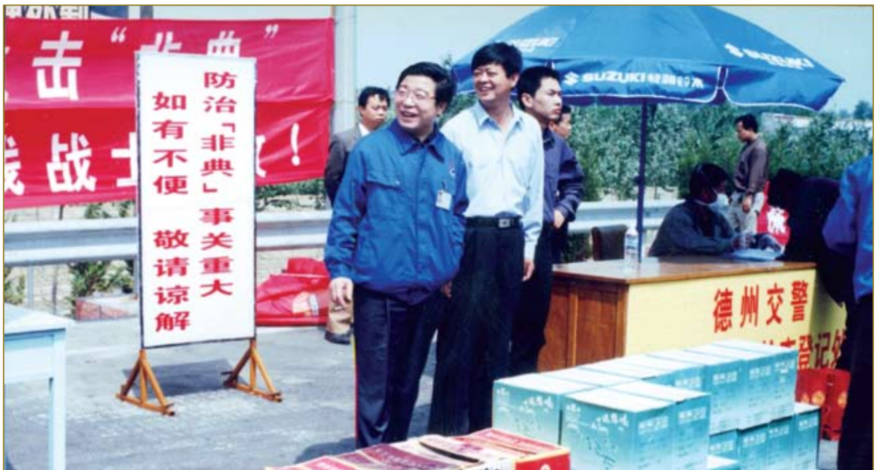
2003年5月，古贝春集团有限公司组团慰问了冀鲁两省的上百个防“非典”检查站，受到社会各界人士的广泛赞誉。