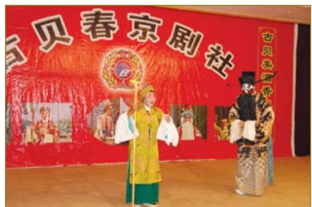
古贝春京剧社的演员们粉墨登场。