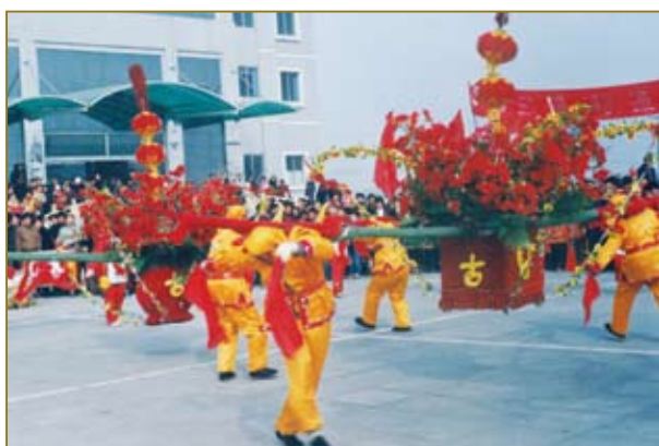
古贝春花杠队参加社会文化活动。