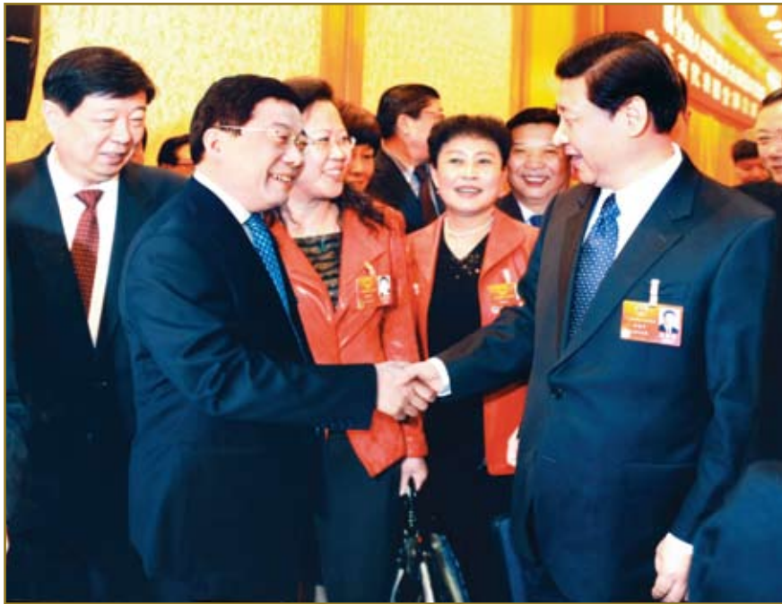
2012年3月，国家副主席习近平与公司董事长、总经理周晓峰亲切握手并交谈。