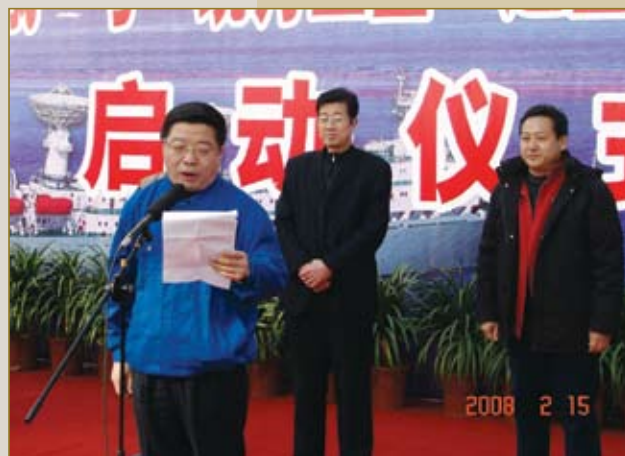
周晓峰在慰问绕月卫星发射保障人员仪式上讲话。