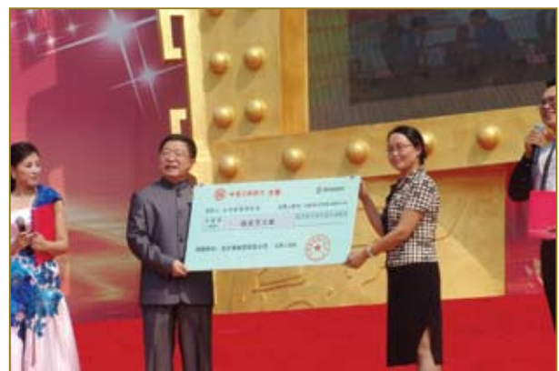
封坛大典向山东慈善机构捐赠。