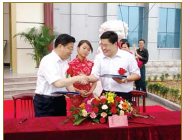
古贝春与武城县邮政局签定“幸运邮天下”合作项目。