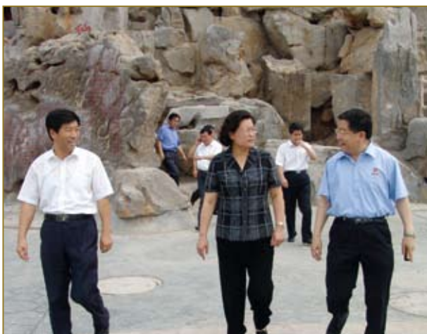
山东省省委常委、统战部长吴翠云来公司视查。