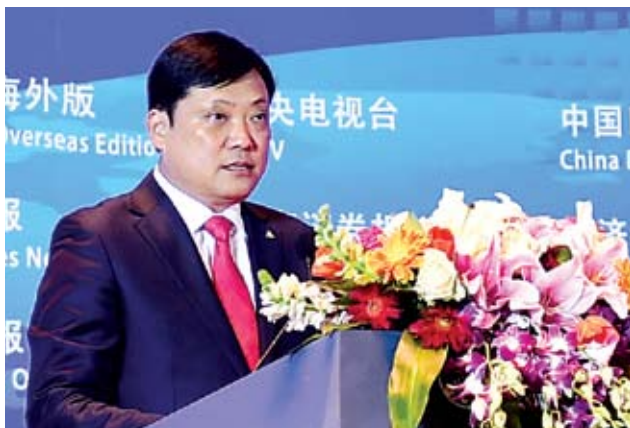
江泰国际联盟主席沈开涛在发布会上致辞。

本次大会安排了近60位来自全球范围的权威风险专家围绕全球各大洲、各个国家的洲际、国别风险以及法律风险、税务风险等进行专业发布，特别是专门针对“一带一路”沿线国家的相关风险进行案例分享，并具体提出风险管理建议和措施。对会员单位有一定的指导意义。