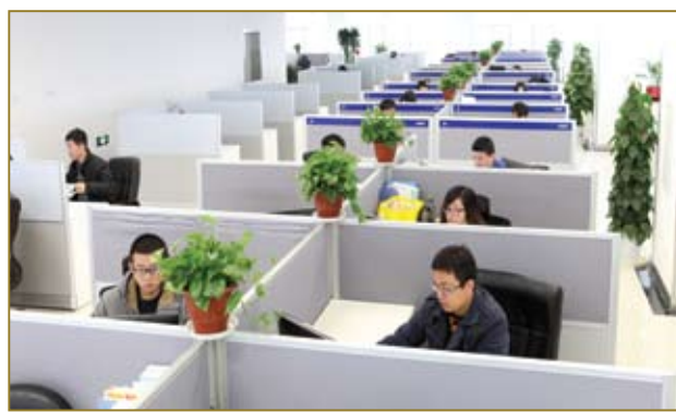
聚精会神的工作人员。