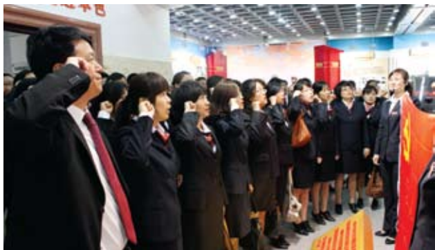
公司党委坚持开展党的各项活动。