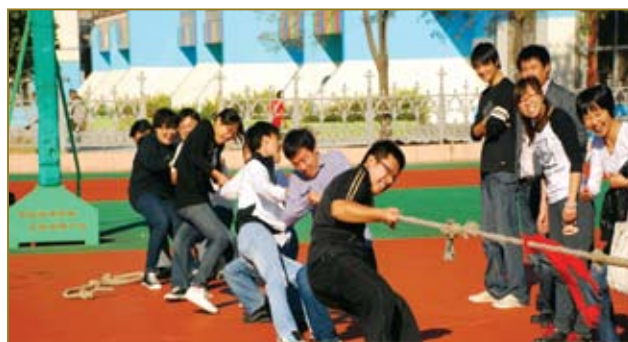
齐心协力志在夺冠。