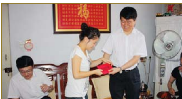
为困难学生捐资助学。