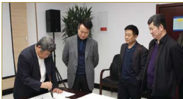
公司领导与首都企业家俱乐部诗书画院进行文化交流活动。