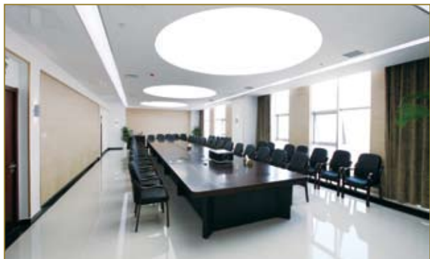
会议室的顶灯被设计成象征和谐的圆形。