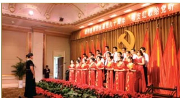
庆祝建党九十周年“唱支红歌给党听”。