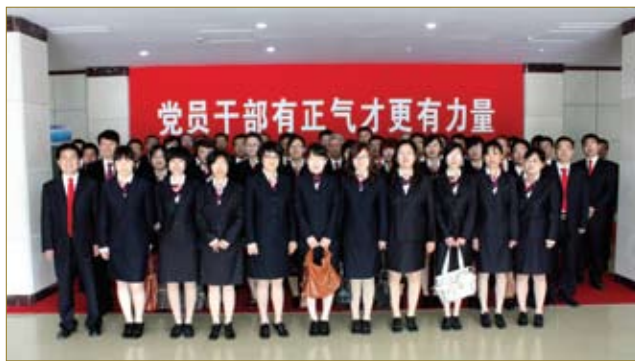
公司常年保持着一支特别能战斗的党员队伍。