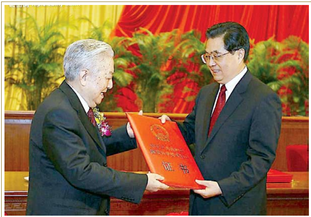
胡锦涛向闵恩泽颁发2007年国家最高科学技术奖。

2010年9月23日，国际小行星中心发布公报，将第30991号小行星永久命名为“闵恩泽号”。