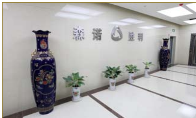
安静整洁的公司驻地。