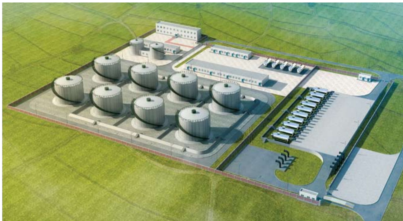
森诺胜利工程有限公司设计案例。