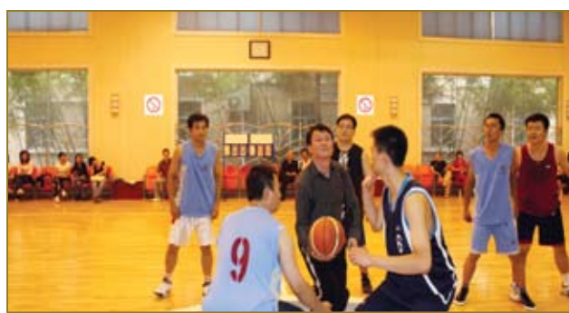
组织员工篮球比赛——“谁与争锋”。