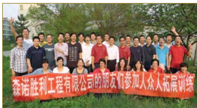
组织员工参加拓展训练。