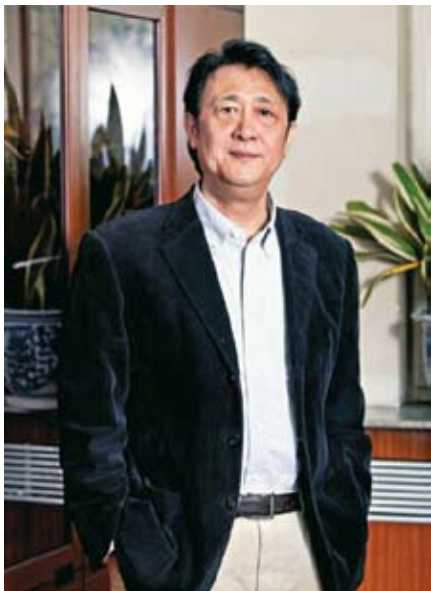
全国政协委员、中国音乐家协会副主席、 首都企业家俱乐部特约理事谭利华